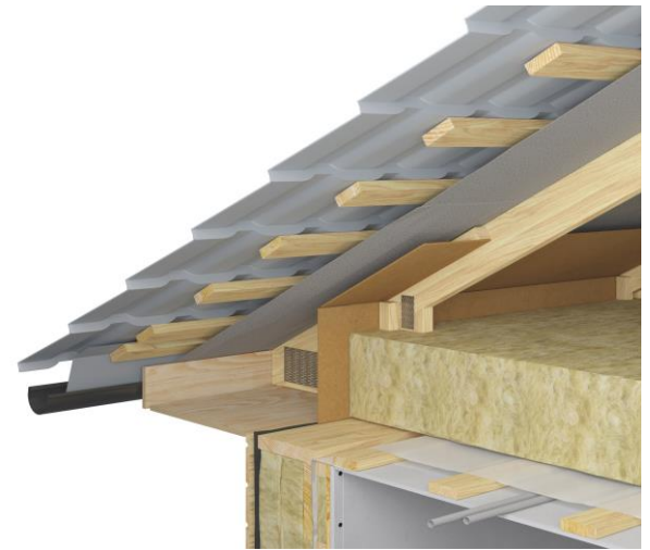
JUMTA SEGUMA PROFILS "BP20B"