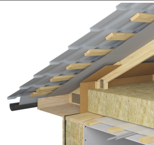
JUMTA SEGUMA PROFILS